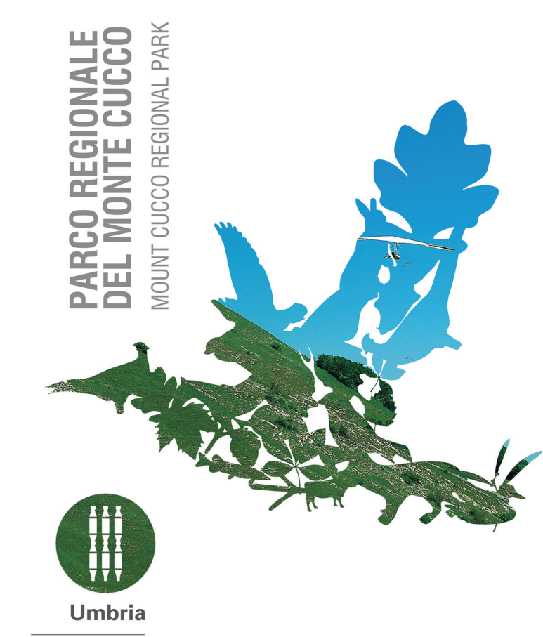
Carta dei Sentieri scala 1:25.000 Map of the trails scale 1:25,000